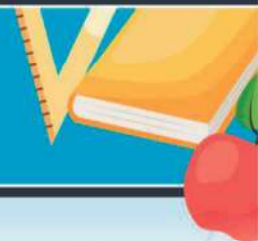
TABELA 13 – Competências Curriculares específicas História